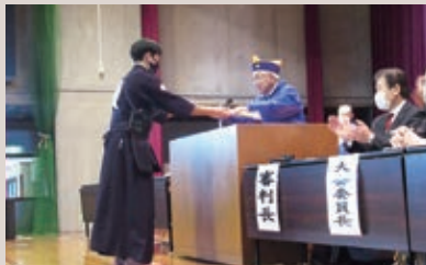
盛岡中津川LC 第44回剣道大会