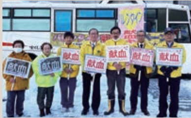
二戸LC バレンタイン献血