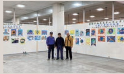
千厩LC 平和ポスター展示