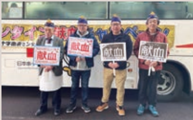
江釣子LC バレンタイン献血