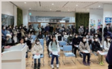
北上LC 平和ポスター展示