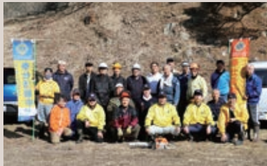
室根LC 蟻塚公園桜の手入れ