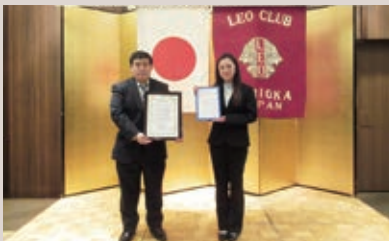
盛岡レオ カレンダー展益金贈呈式