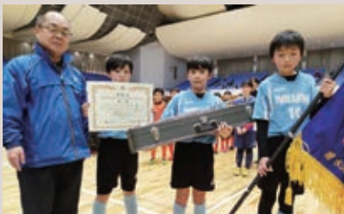
水沢中央LC 第16回水沢中央LC旗フットサル大会