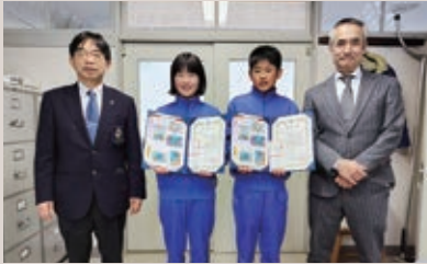
安代LC 平和ポスターコンテスト表彰