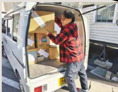
能登半島へ支援物資輸送