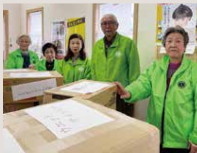
支援物資受付仕分