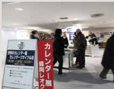
世界のカレンダー展・カレンダーリサイクル市