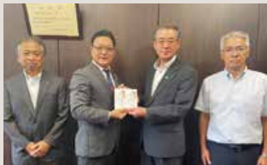
陸前高田LC 学校支援