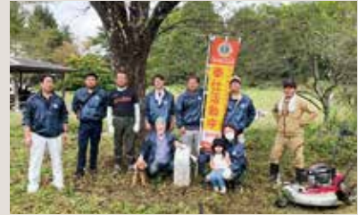
盛岡観武LC 子鹿公園清掃