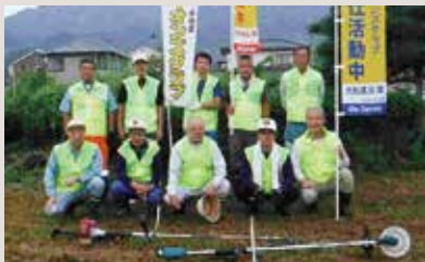
大船渡五葉LC みどり町公園草刈り