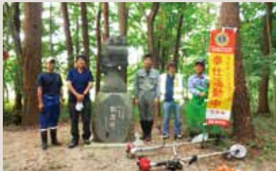
花巻東LC ライオンズの森清掃活動