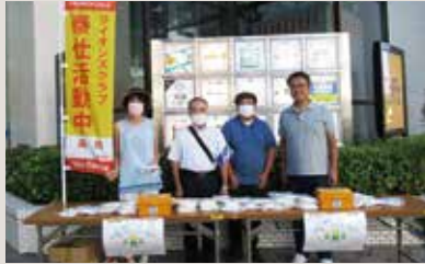
盛岡レオ ひかりの箱街頭募金活動