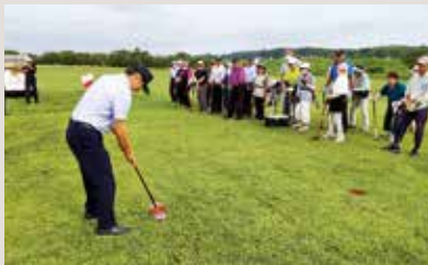
花泉LC グランドゴルフ大会

県立花巻清風 支援学校みなみ 分教室の生徒の 皆さんと、総合運 動公園のベンチ のペンキ塗り