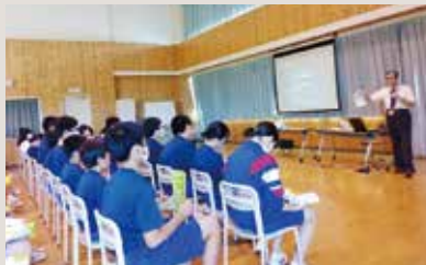
千厩LC 薬物乱用防止講座