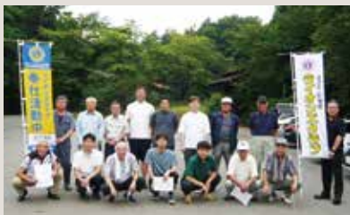
北上国見LC 早朝清掃奉仕