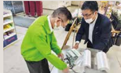
釜石LC ひかりの箱募金回収