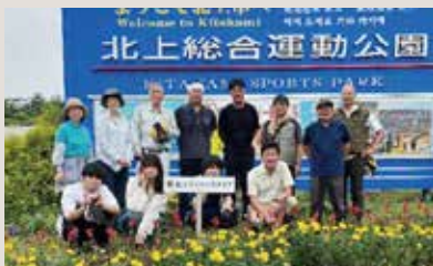
北上LC 花壇整備・水やり