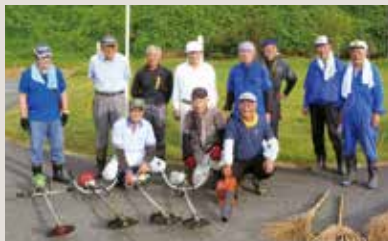
千厩LC 駒場交流公園草刈り奉仕