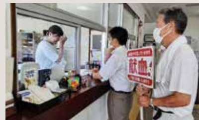
安代LC 献血推進活動