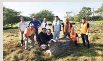
前沢LC 牛の博物館草取り