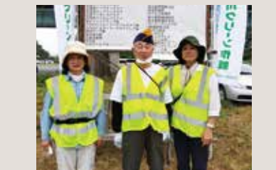
花巻LC 豊沢川クリーン作戦