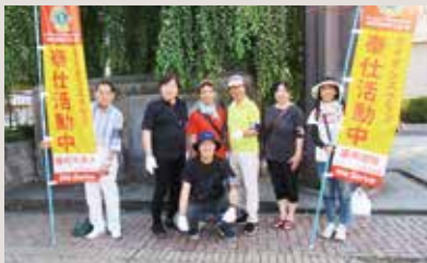
盛岡不來方LC クリーンアップ作戦