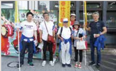
盛岡中津川LC クリーンアップ作戦