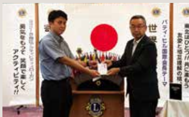
二戸LC 防犯協会へ助成金贈呈