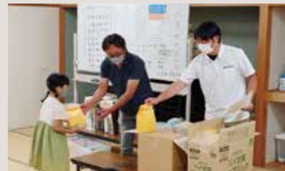
江釣子LC まるまる学び塾へおやつ提供