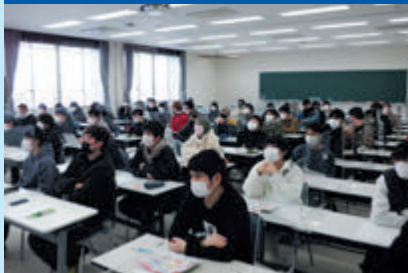
薬物乱用防止セミナー開催