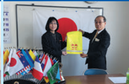
ランドセルカバー贈呈