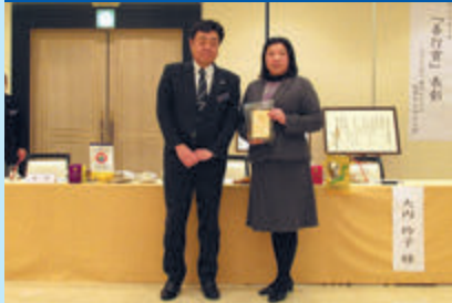
奥州わらすば善行賞