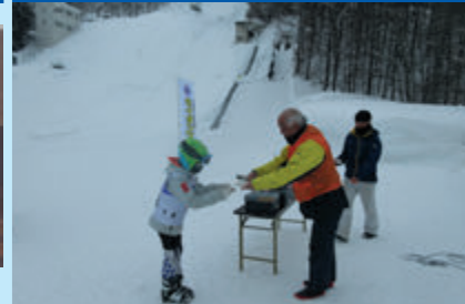
第28回安代ライオンズクラブ杯安代地区小中学校スキー大会