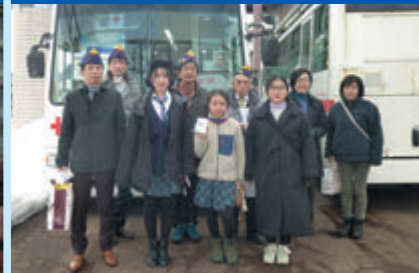
献血推進活動（バレンタイン献血）