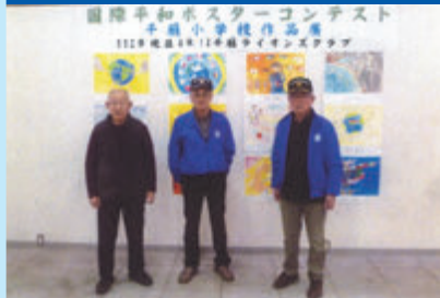
第35回国際平和ポスターコンテスト応募作品展示会開催