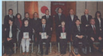
2023年世界のカレンダー展並びにカレンダーリサイクル市益金贈呈式