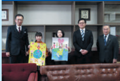
国際平和ポスターコンテスト表彰式