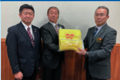
ランドセルカバー贈呈