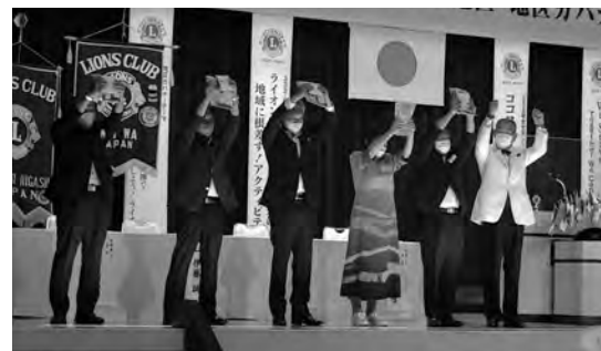
栗村ガバナーより記念品贈呈