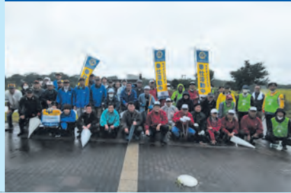
合同ACTあじさい剪定