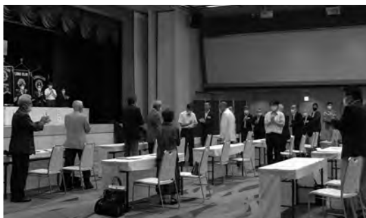
栗村ガバナー入場

ゾーン内各クラブから要望のあった会食は、コロナ禍対策上できなくなり、皆さんにテークアウトにご協力頂き、解散致しました。