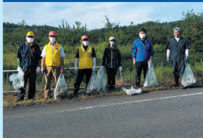
国道沿いのゴミ拾い実施