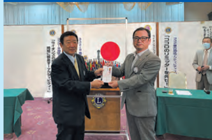
深山神社神楽保存会助成金寄贈