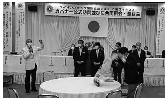
栗村ガバナーより記念品贈呈