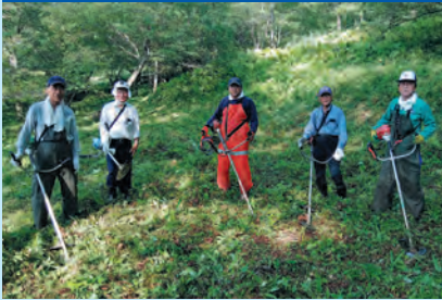
ライオンズの森栗園での草刈り作業