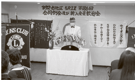
ガバナーから新入会員への歓迎の挨拶

正直、クラブ存続に不安を感じていた自分にとっても意味深い、貴重な体験になりました。「We Serve」の精神に立ち返り、再スタートの気持ちで気を引き締めて活動して行きます。これからも皆様のご指導ご鞭撻をよろしく申し上げます。