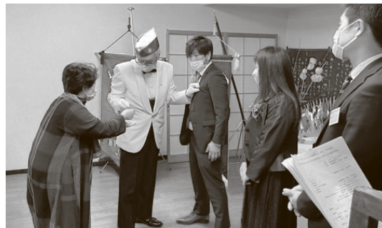
ライオンバッジを付けてもらう新入会員