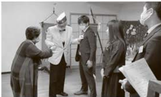
ライオンバッジを付けてもらう新入会員

正直、クラブ存続に不安を感じていた自分にとっても意味深い、貴重な体験になりました。「We Serve」の精神に立ち返り、再スタートの気持ちで気を引き締めて活動して行きます。これからも皆様のご指導ご鞭撻をよろしくお願いします。