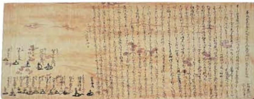
◀後藤寿庵がローマ教皇へ送った奉答書

カトリック水沢教会1階には「寿庵記念ホール」があり、関連資料が展示されています。是非、一度お立ち寄りください。