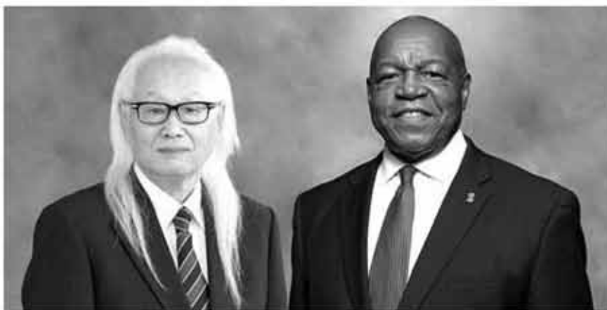
国際会長ダグラス・X・アレキサンダー・L.とバーチャル2ショット

ライオンズは心からの奉仕を届け、この上ない喜びを感じます。それが私たちの報酬なのです。無心の心で時間を捧げ周囲の人たちの暮らしが変わる事以外は何も求めません。心からの奉仕とは私たちの組織とメンバーの動機を示すものです。私たちの奉仕の情熱を輝かせれば何でもできます。