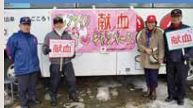
バレンタイン献血活動