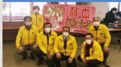
バレンタイン献血活動