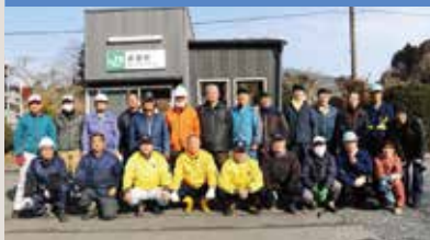
折壁駅桜の木の伐採作業