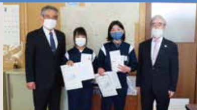
平和ポスターコンテスト入賞者表彰(城北小学校)