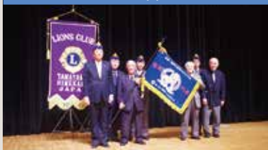
啄木かるた大会盛岡代表旗贈呈式