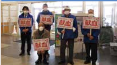
バレンタイン献血活動