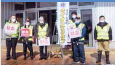
バレンタイン献血活動