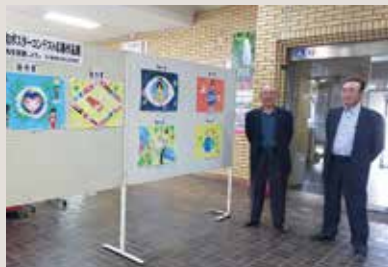
平和ポスター展示会