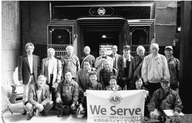
内蔵前にて両 LC の記念撮影