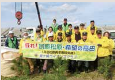
勝利! 景勝高田 希望の高田