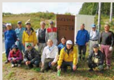
ほっこり家刈り払い草払い