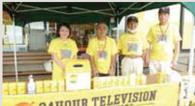
24時間テレビ募金活動