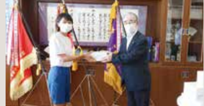
厨川中学校マスク寄贈