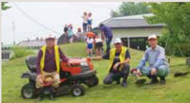
ライオンズ公園整備作業