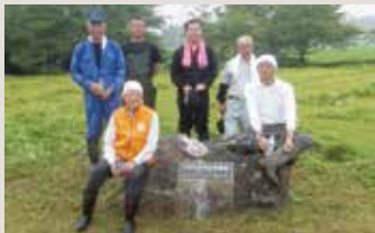
牛の博物館敷地内草刈り