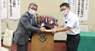
二戸地区防犯協会へ助成金贈呈