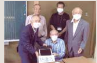
川崎寿松苑にオンライン面会システム タブレット端末寄贈