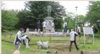
後藤新平像及び周辺の清掃作業