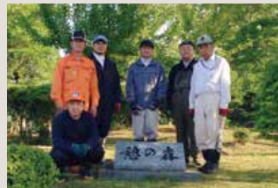
ライオンズの森の草刈り・剪定