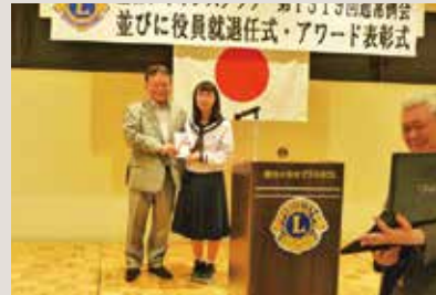
活動支援金贈呈式