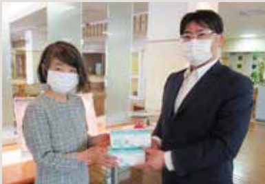
「未使用マスク」収集並びに寄贈