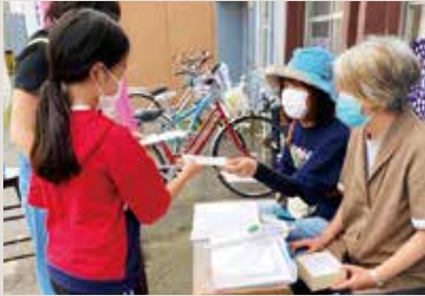
子供食堂でのマスク配布