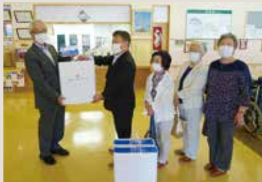
あいぜんの里にマスク寄贈