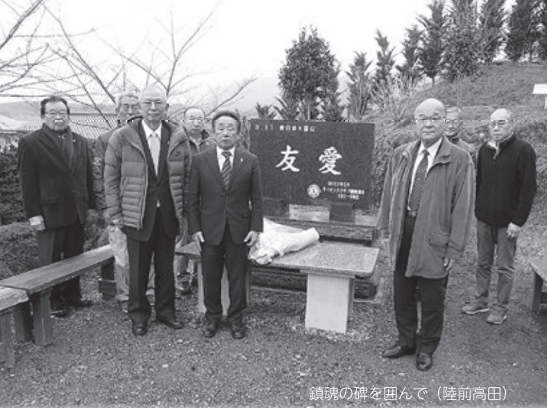
鎮魂の碑を囲んで（陸前高田）