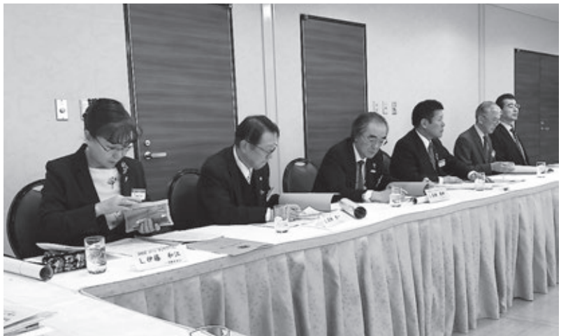
全ゾーン・チェアパーソン10名が揃う