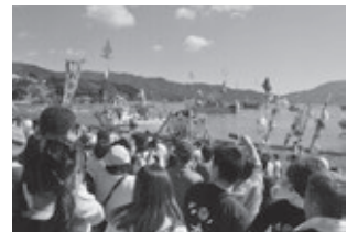
これより海上渡御へ