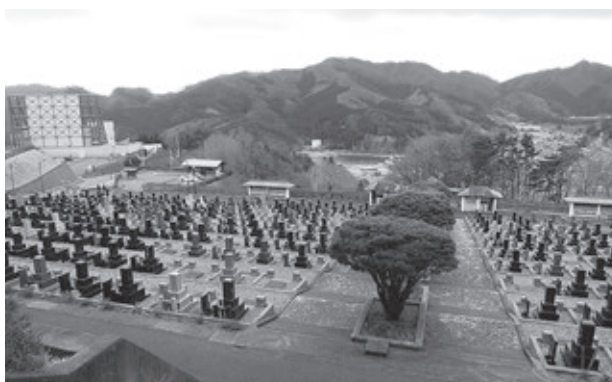
大平墓地公園からの眺望。左手に釜石市立「鉄の歴史館」が見える