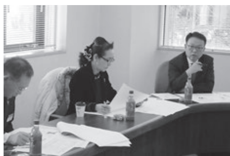
文章の表現について意見を出し合う