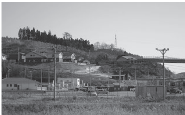
ライオンズの森のそばに三陸道（右）が走る