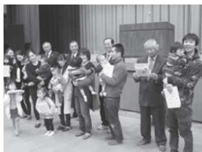
ブックスタート事業

このようなクラブの事業や活動報告を「室根LC活動広報誌」として発行し全戸に配布しライオンズをPRしています。これまで数々のアクティビティの基礎を築かれた諸先輩方々の思いを受け継ぎ邁進してまいりたいと思います。