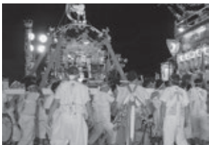
あたりは闇に包まれ、お祭りの終章へ、いざ!

最後に各メンバーの意見を一つ一つ大事に聞きながら頑張っていきたいと思っております。