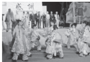
AOMORI花嵐桜組 よさこいソーランの演舞。震災後9年連続で山田まつりに駆け付け、被災者を勇気づけてくれています