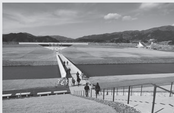
国営追悼・祈念公園の防潮堤から道の駅高田松原・津波伝承館を望む