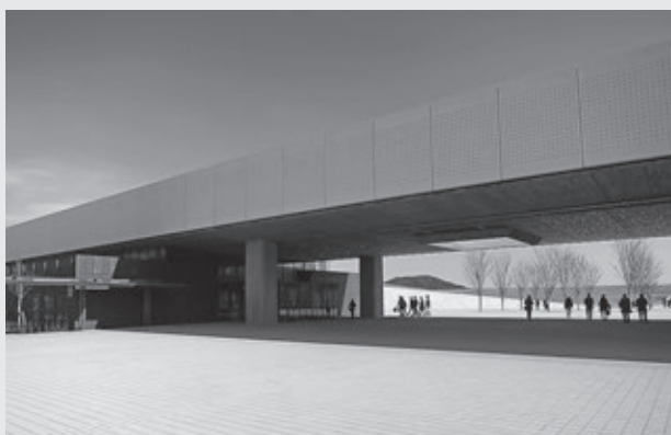
津波伝承館（左）から防潮堤が見える

2019年9月22日に陸前高田市の高田松原津波復興祈念公園内に津波伝承館「いわてTSUNAMIメモリアル」がオープンしました。東日本大震災津波による犠牲者への追悼と鎮魂や3.11の惨禍と教訓を世界中の人々に伝え続ける施設です。鎮魂の碑を訪れた際には足を運ばれてはいかがでしょうか。