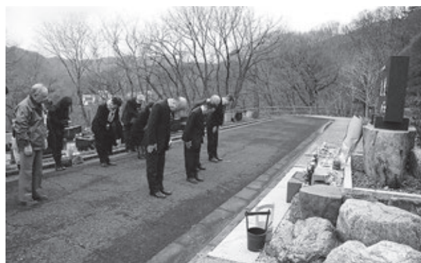
大平墓地公園の鎮魂の碑に冥福を祈る釜石LC会員の皆さんと地区ガバナー