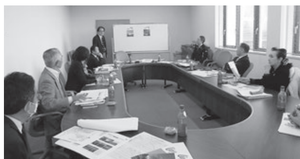
表紙の候補となる2案から、多数決で1案を決定