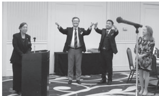
第1079回例会 手をつなぐ「また会う日まで」を合唱