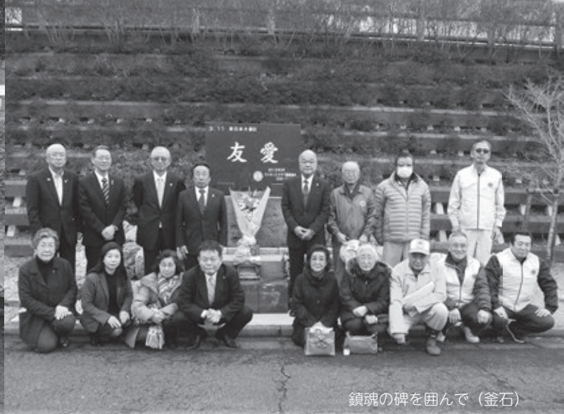
鎮魂の碑を囲んで（釜石）