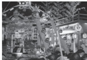
おまつりひろばで一休みのお神輿