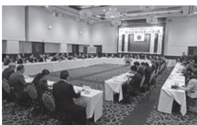
地区運営報告を受ける会場の様子