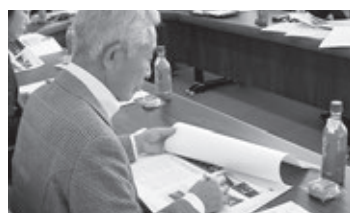
編集会議までに仕上がった校正紙をもとに内容を確認します。

久慈駅発「北ルート」は、北三陸久慈の旬鮮レストラン・お食事処「おおみ屋」さんの「うにあわび弁当」を味わっていただきます。ご飯が見えないほどに、鮮度抜群、しかも量もふんだんにあわび・うに・カニ・イクラが並んでいます。順序良く食べてもよいし、混ぜた状態で口に運んでも美味しい海鮮弁当です。