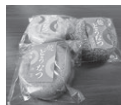
毎回の編集会議のお楽しみ。盛岡の銘菓