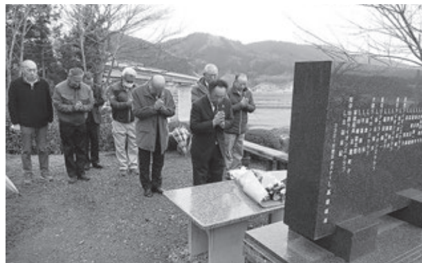
ライオンズの森の鎮魂の碑に冥福を祈る陸前高田LC会員の皆さんとZC L.伊藤、地区ガバナー