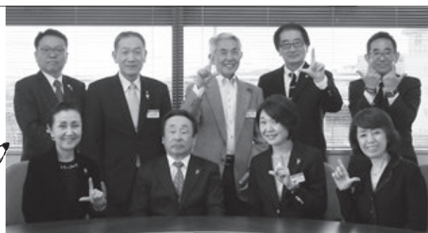
編集会議のメンバー。3月の編集会議にはガバナーも参加となりました。

今月号の確認が終わった後は、次号の構成案を確認しながら掲載内容を精査しています。さらに、校正の精度を高めるため校正グループ（月ごとに交替）に持ち帰ってもらい後日回収しています。