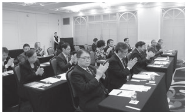
次期の役員を決めた選挙会