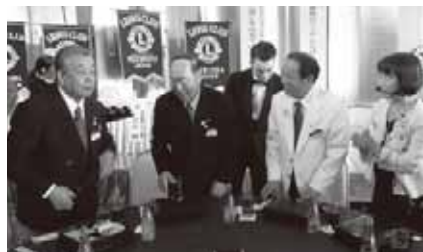
昼食時ガバナーを囲み和やかな一コマです