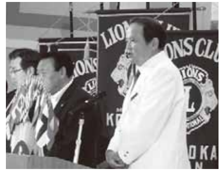
地区ガバナーの挨拶

2017年8月3日(木) 1R1Zガバナー公式訪問が、盛岡市・盛岡グランドホテルに於いて開催されました。