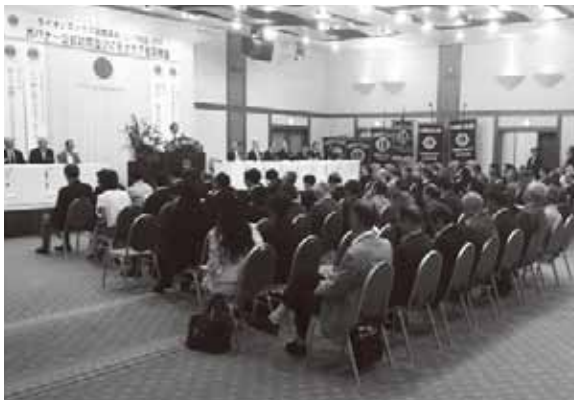
ガバナー挨拶 全景

最後になりましたが、キャビネット役員の益々の活躍をご期待申し上げ、また、ゾーン内のクラブ会員の皆様に感謝を申し上げ報告といたします。