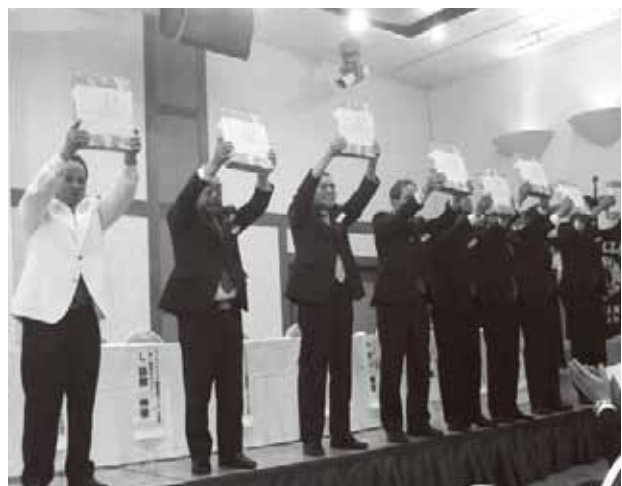
キャビネット役員へ記念品・ローア