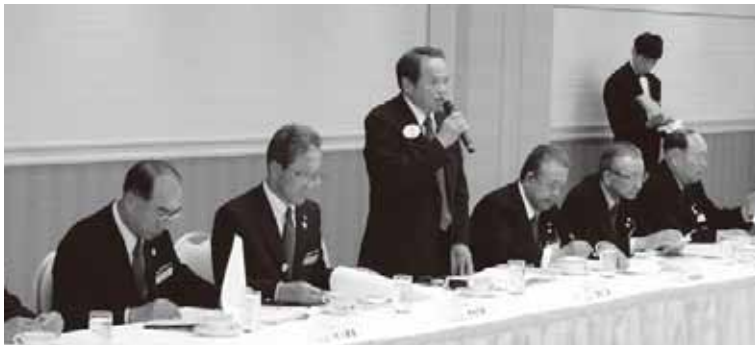
地区ガバナー・クラブ四役談会