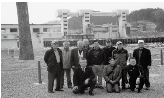
奇跡の一本松前で「はい・チーズ」

られれば」と挨拶。翌日は、大船渡市場で買物し、陸前高田市の「奇跡の一本松」を見学。一本松を朝日が眩しく照らしていて、てっぺんを見上げるのが何か切ない気持ちにさせられた。そして竹駒の小高い丘にある忠魂碑「友愛」で亡くなられた会員（23名）に黙祷を捧げて、帰路に着いた。震災から6年を迎えるが、被災地はまだまだ復興の道半ばであり、課題山積、復興への道のりは遠いと感じたし、LCとしても支援を続けていかなければならないと思う。