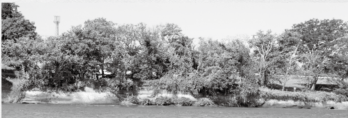
北上川東岸から見たイギリス海岸