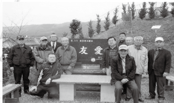
忠魂碑「友愛」の前で記念写真