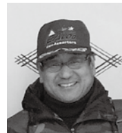
ライオンズクラブ国際協会 330-A 地区 9R2Z 東京レスキューライオンズクラブ 支援隊長