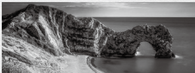
イギリス海岸ジュラシック・コースト海岸