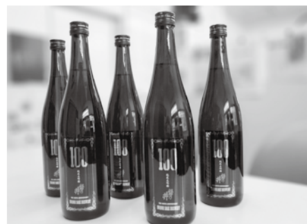
磐乃井の淡麗な飲み口をぜひご賞味ください

ライオンズクラブ国際協会創設100周年にちなんで、「100周年記念プレゼント」をご用意しました。国際協会の創立と同じ1917年に創業した磐乃井酒造の吟醸酒100本、ケーキ100個、レオクラブ作成の鉢花100個を、抽選でプレゼントいたします。