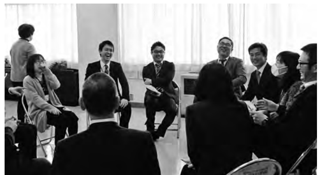
初めは緊張していた参加者も、すぐに打ち解けた雰囲気