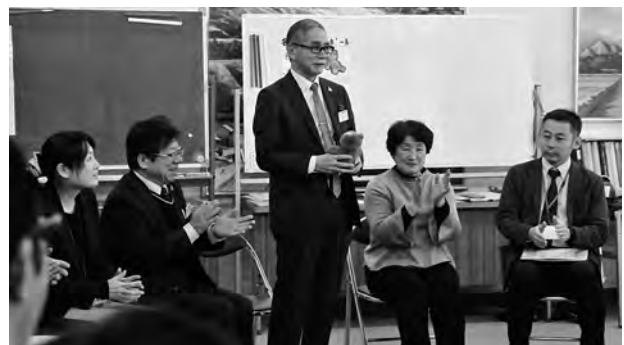
ぬいぐるみをバトン代わりにして発言しやすくする