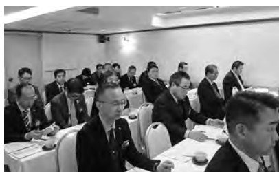
真剣に受講する新会員