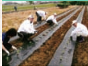
水沢フラワーロード植栽