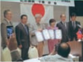
東京桜田門LC姉妹締結調印式