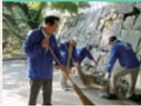
盛岡城跡公園清掃作業