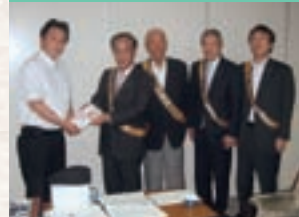
大槌町みどり幼稚園新園舎建設支援金贈呈