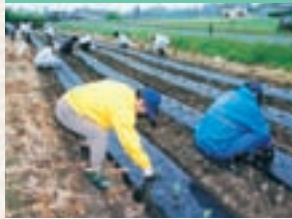
水沢フラワーロード植栽