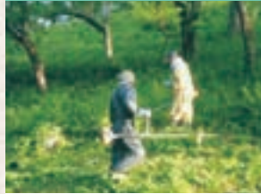
ライオンズの森環境整備