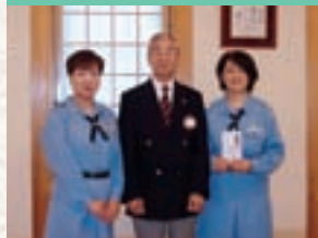
岩手第7回ガールスカウトへ助成金拠出