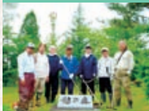
ライオンズの森草刈