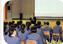
薬物乱用防止教室