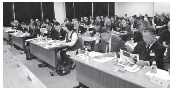
熱心に受講する参加者