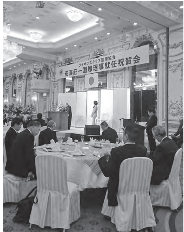
多数のライオンズが参加した盛大な祝宴