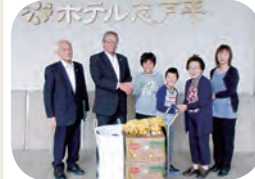
清光学園生徒 志戸平温泉招待