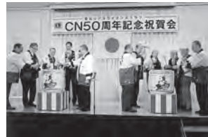
ご来賓による鏡開き