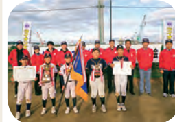
久慈LC杯学童野球交流大会