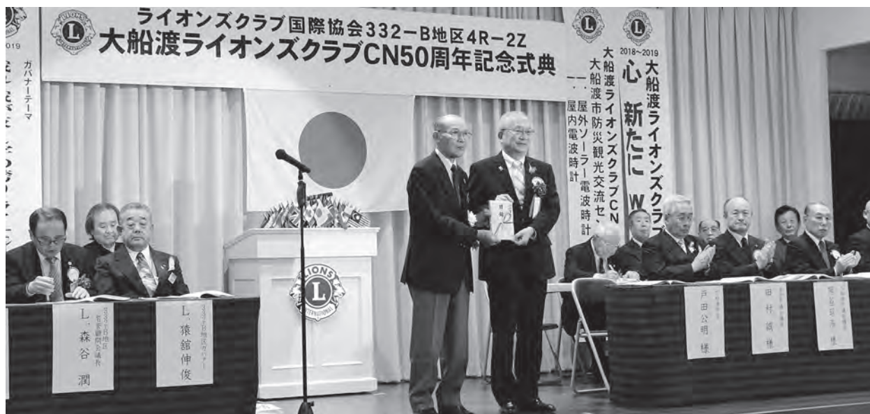
記念事業寄贈品の目録贈呈