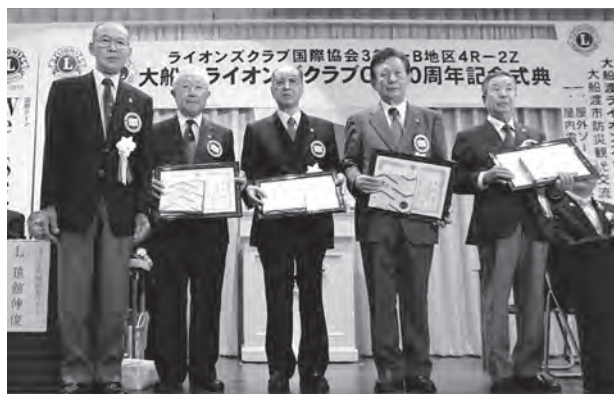
クラブに貢献した会員の表彰式