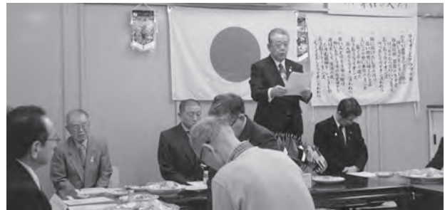
ガバナーよりお祝いの言葉