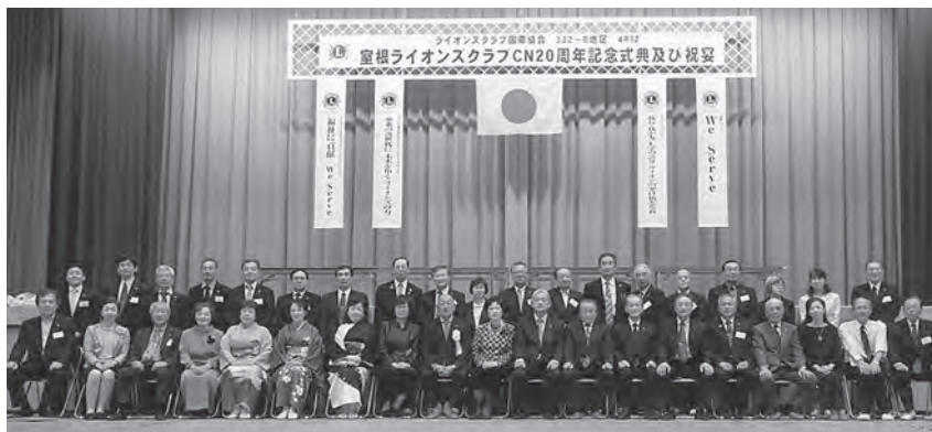
クラブ会員記念撮影

20年を振り返りますと室根にライオンズクラブが無かったら多くのライオンとの出会いがあったのでしょうか。奉仕活動での感動と感謝があったのでしょうか。多くの仲間とより親しく付き合う事が出来たのでしょうか。そう思うとライオンズクラブが私達に与える影響の大きさを改めて感じています。今後も地域社会の活力向上作りのきっかけになるような活動が出来ればと思っています。今後とも一層のご指導・ご鞭撻をお願い申し上げます。大変ありがとうございました。