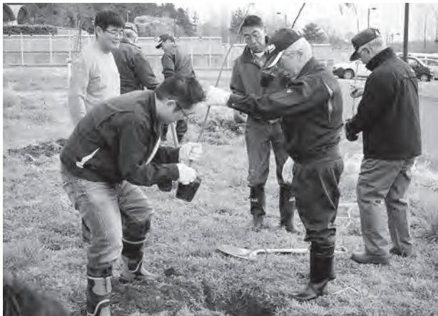
アースデー、4月22日に桜の木を植樹しました