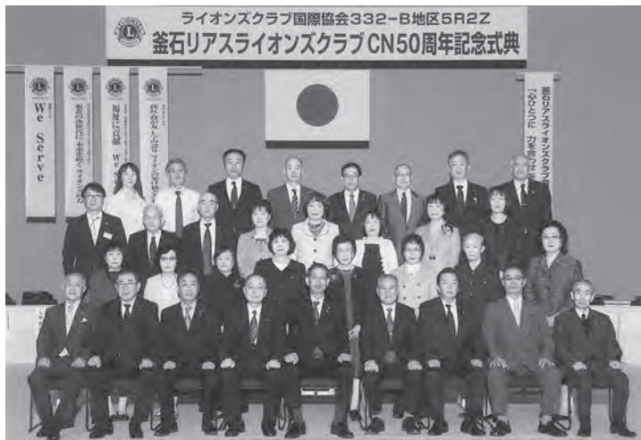
クラブ会員記念撮影