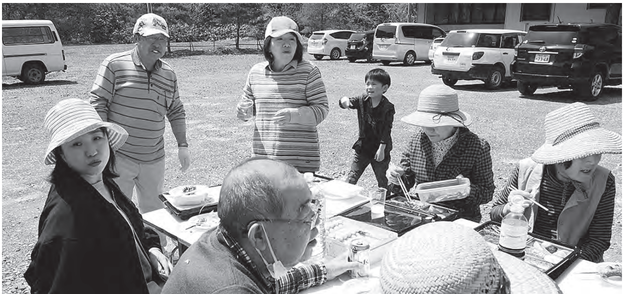
アクティビティだけでなく、会員・家族同士の親睦を深める家族会も行っています