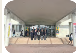
少年剣道選手権大会