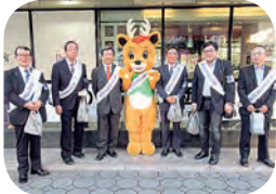
暴力団追放街頭キャンペーン