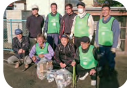
ライオンズ奉仕デー清掃奉仕