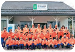
石鳥谷駅清掃奉仕