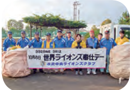
ライオンズ奉仕デー清掃奉仕