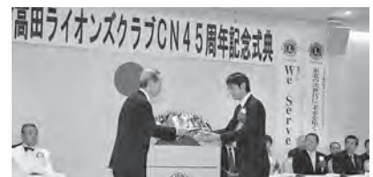
記念事業目録贈呈