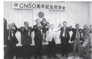
生演奏「また会う日まで」