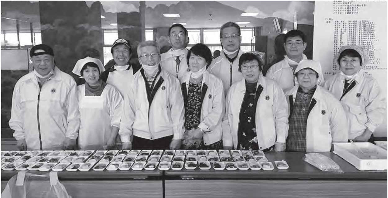
1月のスポーツ少年団武道大会激励のための餅つきはLL、家族会員と協力し実施しています