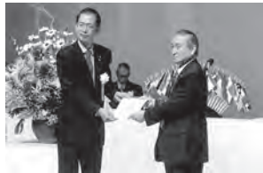
釜石市長へ記念事業目録贈呈