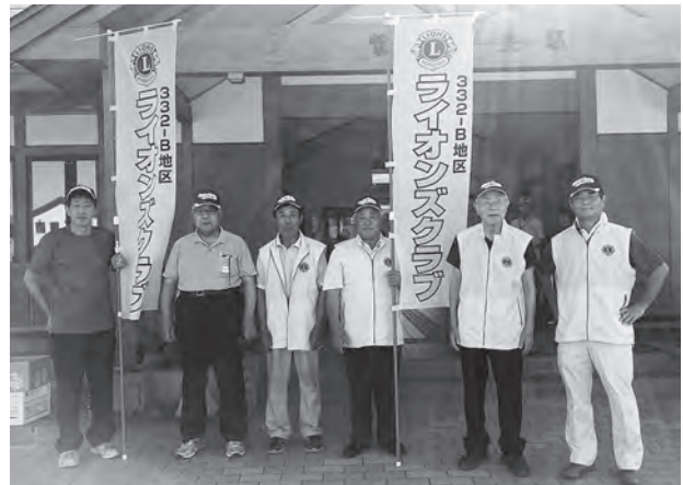
薬物乱用防止PR活動を8月に行いました