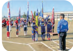
花泉LC杯ソフトボール大会