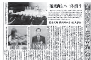
「復興釜石新聞」10月17日記事