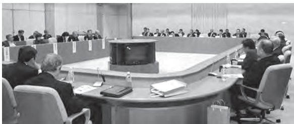
クラブ会長が一同に会し有意義な議論が交わされた

最後に、これからのライオンズを変えて行くのは皆様ですとの言葉が記憶に残りました。