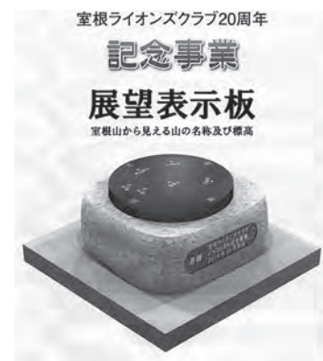
20周年記念事業 室根山の展望表示板