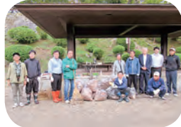
ライオンズ奉仕デー清掃奉仕