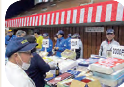
チャリティバザー