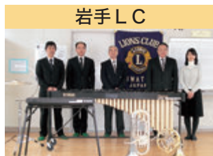
岩手 LC 沼宮内中学校吹奏楽部に楽器を寄贈