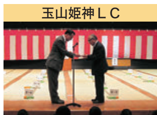
玉山姫神 LC 啄木かるた大会へ協賛金抛出