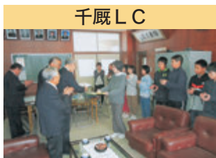
千厩 LC ライオンズ国際平和ポスター・コンテスト 表彰式