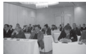
熱心に聞き入る54名の参加者