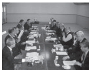
熱心に発表・協議する参加者