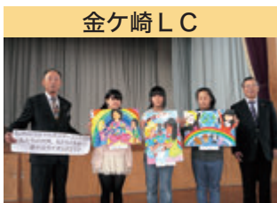
金ケ崎 LC ライオンズ国際平和ポスター・コンテスト 表彰式