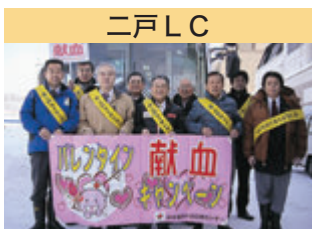
二戸 LC 献血推進活動