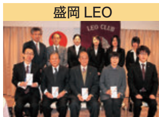
盛岡 LEO カレンダーリサイクル市益金をユニセフ等に贈呈

千厩アイスアリーナで遊ぶ子ども達の表情は明るく楽しそうです。県南唯一のスケートリンクということもあり、土日には数百人の市民がスケートを楽しみにやってきます。千厩のスケートリンクの歴史は古く、30数年前、地元商工会青年部の会員数人が集まり、何とか地域の子供達にスケートリンクを作ってやりたいとなったそうです。早速会員の田んぼを借り、水を入れて溜め、何日間かの寒い夜を青年部員が交代で田んぼの水管理に費やしたのです。そしてとうとう立派な天然のスケートリンクを子ども達にプレゼントし、親子一緒に楽しく滑ったそうです。