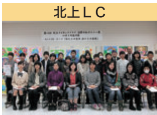
北上 LC ライオンズ国際平和ポスター・コンテスト 表彰式