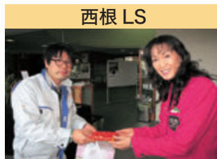
西根 LS 献血推進活動 バレンタイン献血