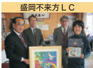
盛岡不來方 LC ライオンズ国際平和ポスター・コンテスト 表彰式