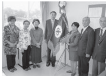
浜松ひかり LC と大船渡市立赤碓中学校を訪問

大会の中身については、市民総参加はもとより、青少年の健全育成にも重きを置き、大会中にチャリティーバザー等を行い、益金を市内の中学