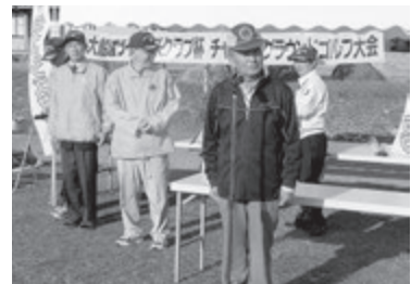
チャリティーグラウンドゴルフ大会で閉会の挨拶