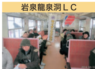
岩泉龍泉洞 LC 三鉄早期復興支援・被災者招待イベント