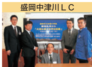
盛岡中津川 LC 薬物乱用防止教室 杜陵小学校