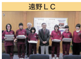
遠野 LC ライオンズ国際平和ポスター・コンテスト 表彰式