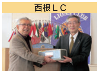
西根 LC 西根むらさきコーラスへ音響機材贈呈