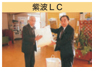
紫波 LC 「にいやま荘」「百寿の郷」 慰問