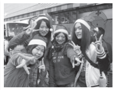
さくら野百貨店前で行ったクリスマス献血の呼びかけ運動