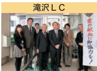
滝沢 LC 献血推進活動 バレンタイン献血