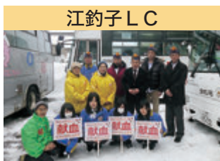
江釣子 LC 献血推進活動 バレンタイン献血