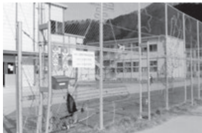
本校舎の予定立たず