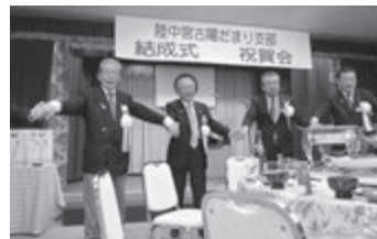
「また会う日まで」を歌う来賓のライオン各位

6名という少人数でスタートした支部ですが、「被災者の自立支援」という社会奉仕活動の、しっかりした考え方から求めあつて結集した仲間であり、今後もその数は増え続けるだろうと思いますし、会員数20名を超え、単独のクラブとして正式に結成される日もそう遠くないと確信しています。