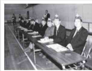
2013年12月4日(水) 水沢商業高校 薬物乱用防止講演会