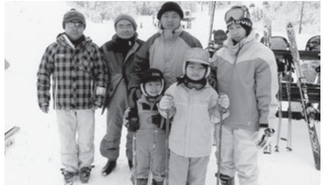
夏油スキー場で初の挑戦