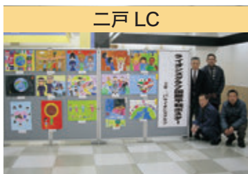
二戸 LC ライオンズ国際平和ポスター・コンテスト