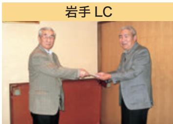
岩手 LC スポーツ少年団助成金拠出