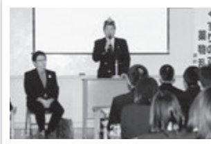
2013年10月23日(水) 水沢南中学校 薬物乱用防止講演会