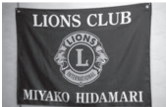
届いたばかりの陽だまり支部旗

での活動から、「被災者支援」という大きな枠組みでの活動を模索していた人たちの考えが一致して花開いた組織だったのです。私たちは多くの仲間と出会い会員増強を進めることができました。彼女らは、ライオンズクラブ国際協会という、とてつもなく大きく、信頼と知名度の高い活動組織を手にすることができたのです。