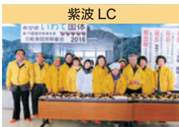
紫波 LC 第 42 回 紫波町スポーツ少年団剣道大会激励