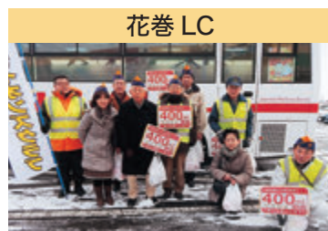
花巻 LC 献血推進活動