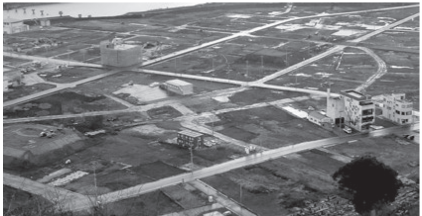
空から見た旧役場周辺の現状

そして復興町づくり懇談会が地域ごとに開催され、県道の幅が当初18mだったのが、コミュニケーションが取れない等の理由か16mに変更する様で、町民の声が届いているのでしょうか。今後2年間何も無い町が? その後どうになってしまうのかな