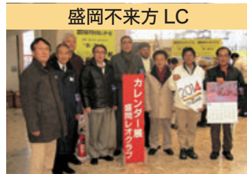
盛岡不來方 LC 盛岡レオ 世界のカレンダー展 協力