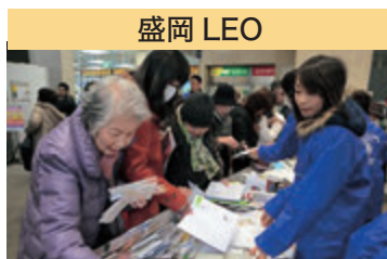
盛岡 LEO 2014年世界のカレンダー展並びにカレンダーリサイクル市