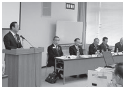
会議の前に新年の挨拶をする佐々木ガバナー