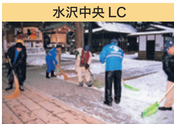
水沢中央 LC 駒形神社清掃