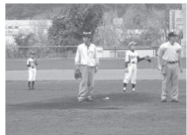
被災地の子供たちを招待し、ライオンズ杯を開催 (始球式の様子)