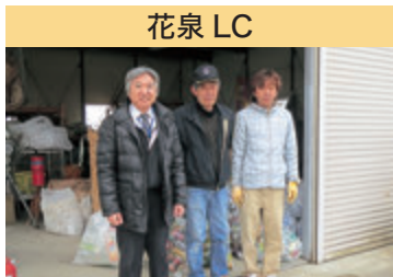
花泉 LC さくら園に資源再利用品の収集支援