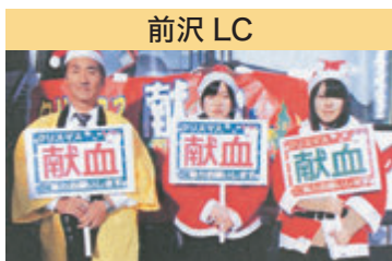
前沢 LC 献血推進活動