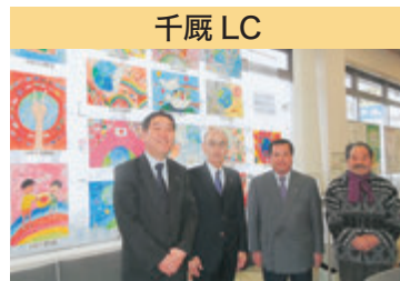
千厩 LC ライオンズ国際平和ポスター・コンテスト作品展示