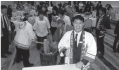
歓迎会での餅つき大会