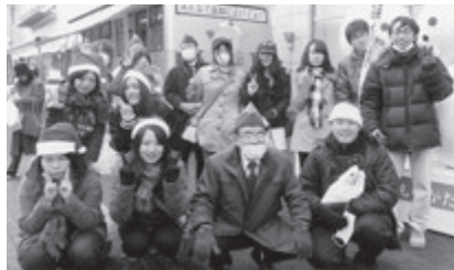
レオクラブとの献血活動