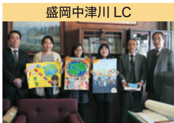
盛岡中津川 LC ライオンズ国際平和ポスター・コンテスト