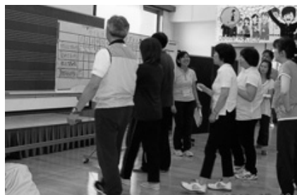
授業風景 全員で提示資料の検討