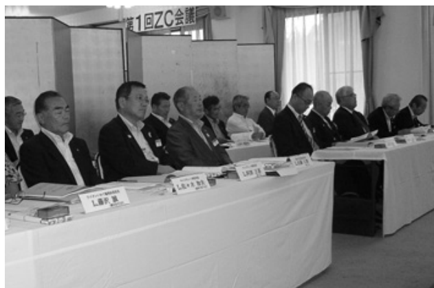
キャビネット会議風景

レポートした私たち「ライオンいわて」の編集委員会も鋭意努力し皆さんの役に立つよう頑張ることを約束します。第1号議案から第10号議案は慎重審議の上、全会一致で承認された。