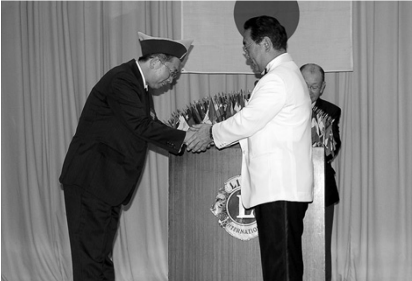
新入会員の戴帽式