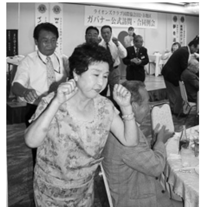
最後は踊りの輪を広げる

又、「被災地にいると、被災地以外に出ると別の世界へ行ったようでホットする気分になる」と本音もチラリ。