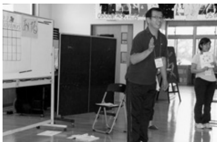
授業実践 小学校3年生「何かをあげて大きくなろう」の授業風景