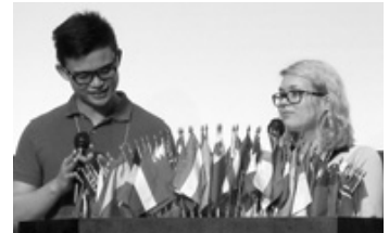
7月28日 YCE生からの提言 (まとめの発表)