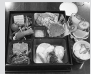
野菜中心の特別メニュー