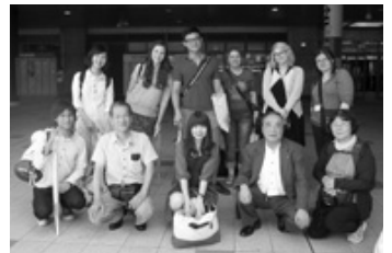
7月28日 仙台駅で(お世話になった方々)