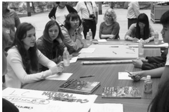
7月27日 YCE生ミーティング (災害について)