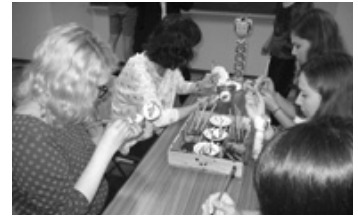
7月27日 みやぎ蔵王こけし館 (こけしの絵付け体験)