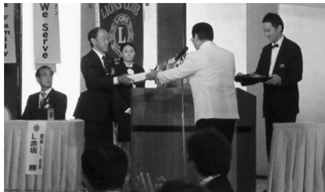
各クラブ会長への記念品とバナーの贈呈