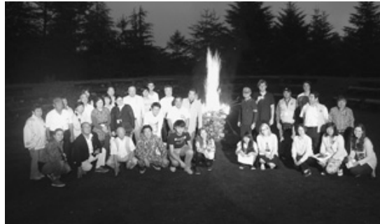
7月26日 蔵王自然の家キャンプファイヤー (このころ一関市では記録的な豪雨でした。ホームステイ先の東山町L. 佐藤宅は床上浸水にみまわれました。)

1日目は仙台東部の東日本大震災の被災地を視察、夜は蔵王自然の家でキャンプファイヤーを楽しんだ。2日目はこけしの絵付け体験、災害についてのミーティング、夜は晩餐会。3日目は「YCE 生からの提言」の発表、記念撮影の後、3日間を無事終了解散した。