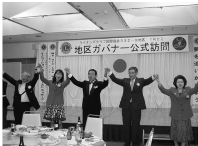
また会う日までを合唱