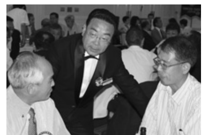
親しく声を掛けるガバナー