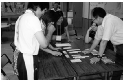
グループで授業実践の資料を検討中

受講後の感想文には、「子供を育てる視点が広がり、すぐにも実践して子供の成長を見たい。」とか「実り多い充実した研修会であった。自分の実践を持ち寄りまた研修会に参加したい。」などの感想が寄せられました。