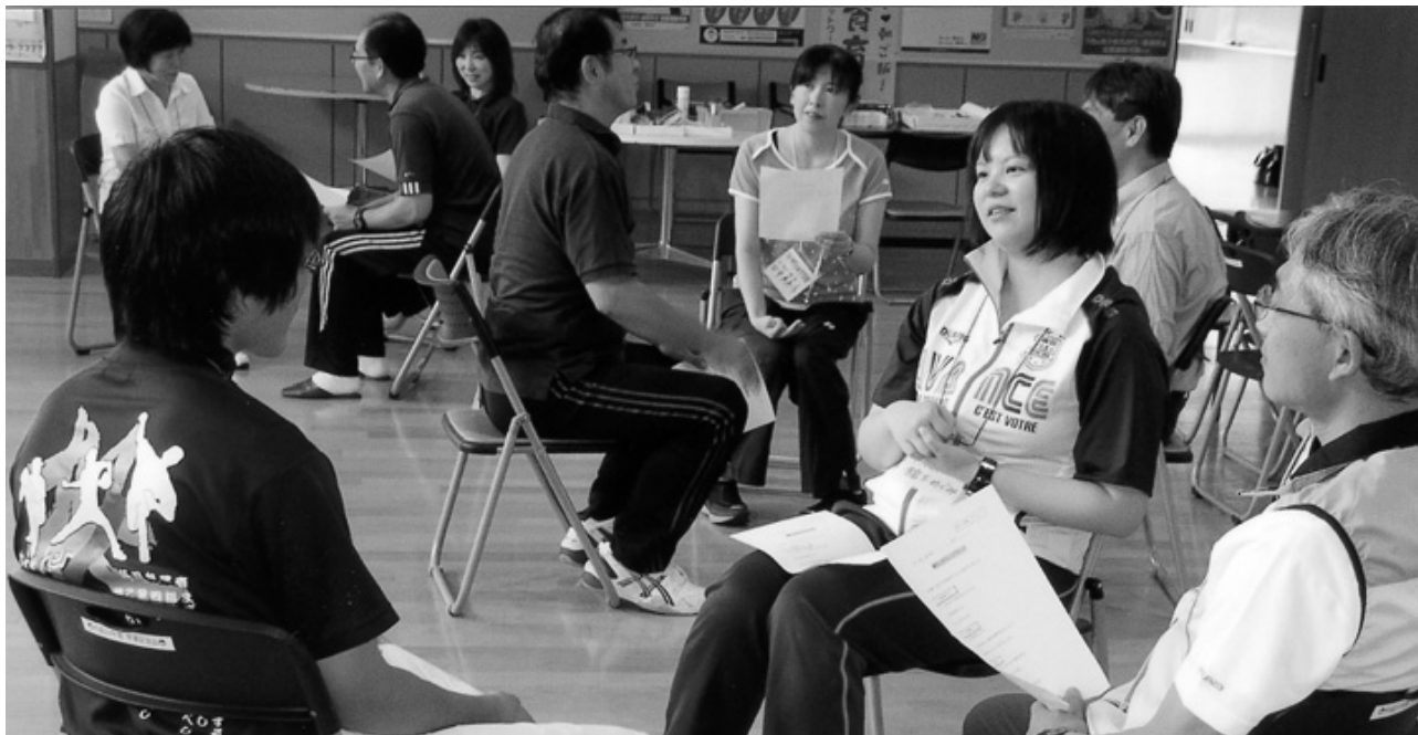
グループ討議 熱心に討議「さあ、どうしよう」

田野畑ライオンズクラブ主催の本年度初めての公募型ワークショップを、田野畑村立田野畑中学校多目的ホールを会場に、関向校長先生をはじめ先生方及び田野畑小学校の先生方等17名の参加のもと開催されました。