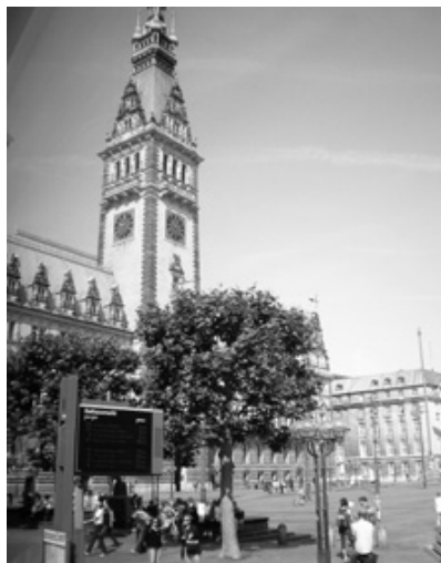
ハンブルグ市内の歴史を感じさせる建造物

圧倒されました。さらに美しい湖と豊かな緑に包まれ、そこには世界中のさまざまな人々が集まり、人種差別の無い街が形成されていました。