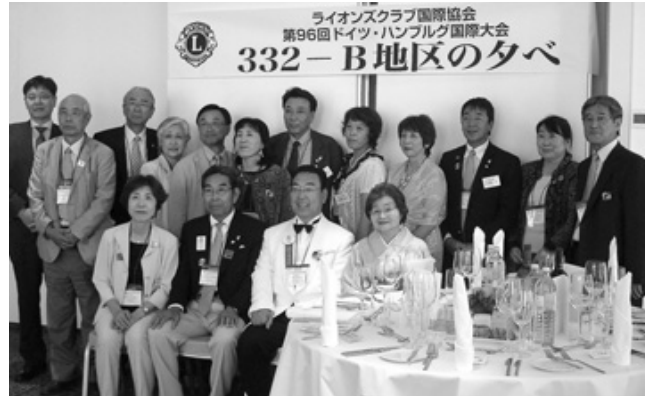
前和賀キャビネット3役、釜石LC、大船渡五葉LCの面々