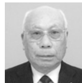
2R2Z ZC L. 藤原有川 北上LC