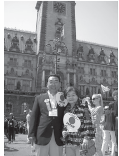
パレード参加時の夫妻

珍道中であったが次のカナダに向け、二人でスピードラーニング挑戦をも夢見ているこの頃である。