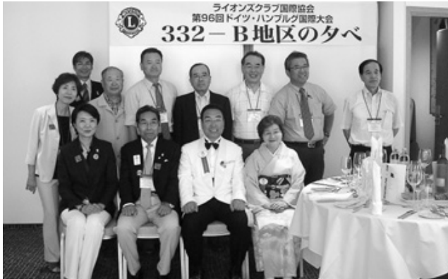
東山キャビネット3役、千厩LC、東山LCの面々