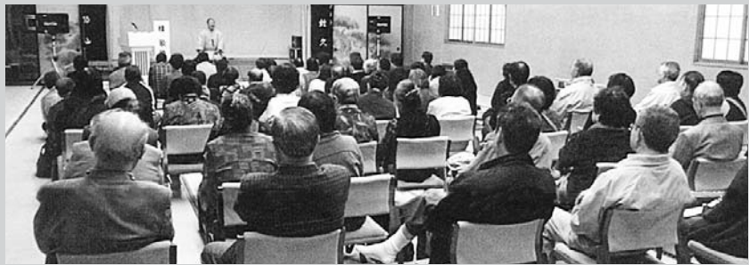
▲復興ボランティア「落語寄席」の様子

なってしまった赤崎中学校に、横浜LCと親交のあるフェリス女学院大学が共同でピアノ・校歌CDを贈呈しました。贈呈式終了後には、女子学生によるミニコンサートが開催され、最後に大学で作成された校歌CDをもとに校歌指導が行われました。指導する方もされる中学生もどちらも熱心に取り組み、感激の言葉をいただきました。