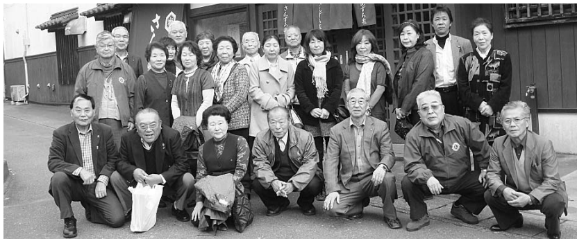
▲大槌「さんずろ家」で記念撮影

震災当時一大兵站基地としての重要性とその活躍を説明、釜石市にて第1回の買い物、大槌町さんずろ家にて昼食、食後は店主より体験談を聞きました。その中で特に強調されたものは沿岸で生活するからには第1は常に危機管理意識を持っていなければならない。第2に生命は自分自身で守らなければならない。第3は津波