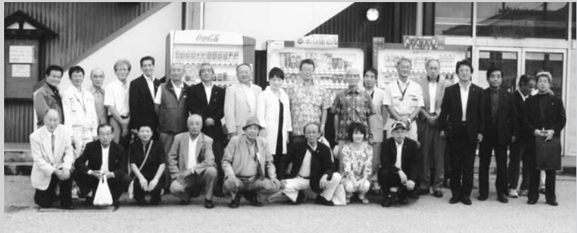
▲震災後、視察に見えた他クラブと一緒に…

さて当クラブの活動状況ですが、主なアクティビティとしては、震災で校庭に仮設住居が建ち、運動する場がなくなってしまった子供達の為に、大阪西LC、岸和田LCの支援のもと盛川河川敷公園少年野球場への設備設置がなされ、6月17日に大船渡市への贈呈式が行われました。又、7月27日には横浜LCの支援の申し出を受け、当クラブでは校舎が全壊し仮設校舎が学び舎と