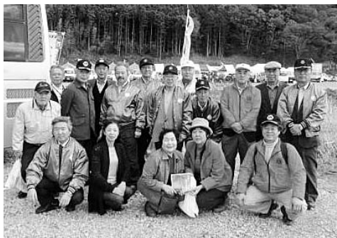
▲特設商店街に到着

約40店舗出店という事でした。高田LCの方々も来場されており、挨拶を取り交わしながら買い物を楽しみました。帰路につき一関駅東口での解散。大震災の残骸が未だ復興の道程の険しさを感じさせ、まだまだ何か手助けができる事があるような気がした。そんな買い物ツアーでした。