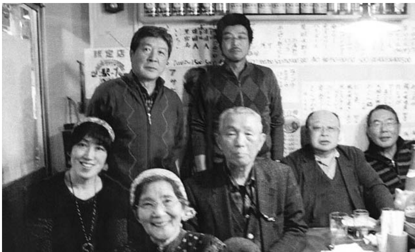
▲「大船渡屋台村」にてお酒が入る前に記念撮影？

今回の買い物バスツアーの実施にあたっては、予め現地に赴き地元ZCとの打ち合わせや運行時間の事前調査と、加えて参加者の協力のお陰であります。我ながら満足した次第。第2回諮問委員会の中でも成功を祝う発言や次回開催の要請も。改めて各クラブと参加者のお礼を申し上げます。