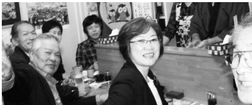
▲「大船渡屋台村」にて笑顔 笑顔!

各クラブでの取り組みは、被災地での寄席広場の提供や炊き出し支援(大東岩手LC)、餅つき隊による仮設住宅での餅振る舞い(東山LC、大東岩手LC)さらには町内にある仮設住宅に住まいしている方への支援とふれあい事業(室根LC、藤沢岩手LC)等さまざまな支援を行い、早期復興を願い活動した。