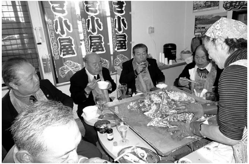
▲カキ小屋での食べ放題の様子