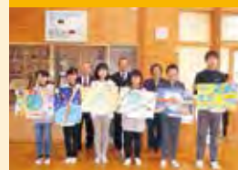
ライオンズ国際平和ポスター・コンテスト