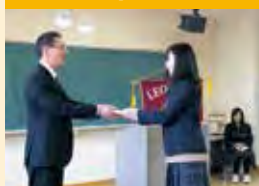
卒業レオ記念品贈呈