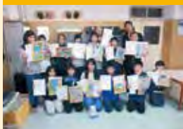
ライオンズ国際平和ポスター・コンテスト