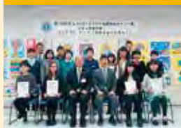
ライオンズ国際平和ポスター・コンテスト