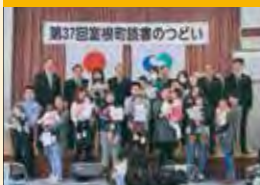
ブックスタート事業 絵本贈呈