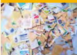
使用済み切手 1000枚送付