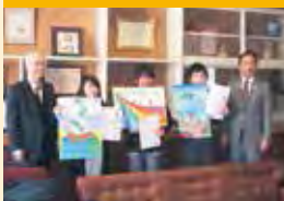
ライオンズ国際平和ポスター・コンテスト