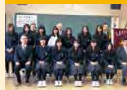
卒業レオを送る会