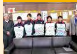
ライオンズ国際平和ポスター・コンテスト

《表紙の写真：たろし滝（大瀬川地内 葛丸川上流）》「たろし」とはつららの意味で、垂氷（たるひ）が訛ったものです。氷柱の形が滝に似ていることから「たろし滝」の呼び名がついたといわれています。