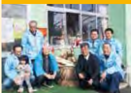
玉里保育所小正月行事