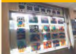
ライオンズ国際平和ポスター・コンテスト