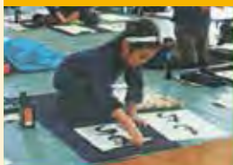
小学生書初め大会