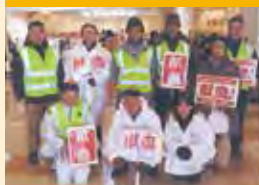
献血推進活動 バレンタイン献血