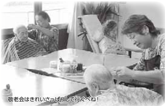
敬老会はきれいさっぱりして行くべね！