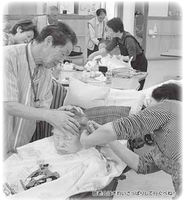
敬老会はきれいさっぱりして行くべね！