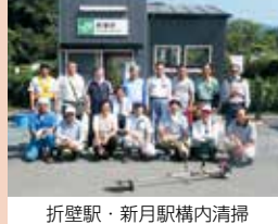
折壁駅・新月駅構内清掃