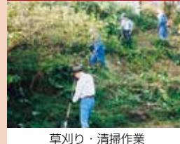
草刈り・清掃作業

《表紙の写真：花巻まつり（花巻市）》 花巻市内にて、秋の3日間開催されます。美しい風流山車や140基にも及ぶ勇壮な神輿、そのほかにも鹿踊り・神楽権現舞・花巻ばやし踊りなどが舞う、花巻を代表するお祭りです。