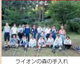
ライオンの森の手入れ