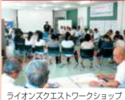
ライオンズクエストワークショップ