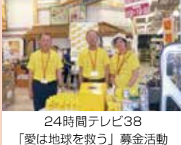
24時間テレビ38 「愛は地球を救う」募金活動