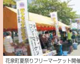
花泉町夏祭りフリーマーケット開催