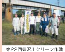
第22回豊沢川クリーン作戦