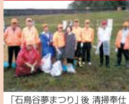
「石鳥谷まつり」後 清掃奉仕