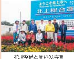
花壇整備と周辺の清掃