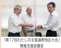
「第17回わたしの主張遠野地区大会」 開催支援金贈呈