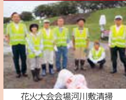
花火大会会場河川敷清掃