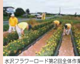
水沢フラワーロード第2回全体作業