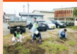
無人駅江釣子駅舎及び周辺の清掃