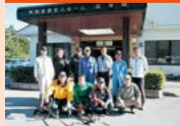
「高寿園」園内草刈清掃