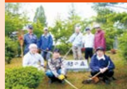
ライオンズの森の草刈