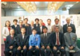
YCE 派遣生支援金贈呈