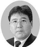
5 R 1 Z 地区 YCE 委員 L. 外里 文人 久慈 LC