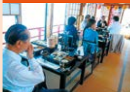
三陸鉄道と屋形船体験