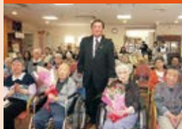
養護老人ホーム「北星荘」慰問