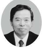
2 R 1 Z 地区 YCE 委員 L. 市川 浜 石鳥谷 LC