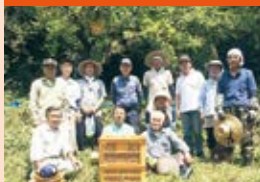
梅園の草刈及び梅の実の収穫