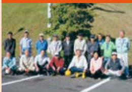
孝養ハイツ法面草刈